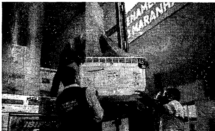
DOSES EXTRAS DE VACINA CONTRA COVID-19 CHEGAM AO MARANHÃO

As doses foram enviadas à Central de Armazenamento e Distribuição de