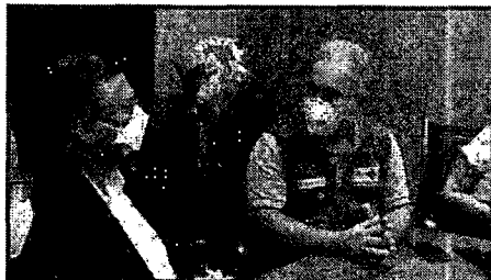
O ministro da Saúde Marcelo Queiroga deu 'cala boca' em Flávio Dino, visitando o Maranhão de surpresa no domingo

Segundo o ministro, o pedido foi feito pelo prefeito de São Luís, Eduardo Braide e o secretário municipal de Saúde, Joel Nunes, devido à confirmação dos casos da variante na região e deve ampliar a cobertura de vacinas