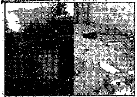
HOMENS ARMADOS INCENDEIAM CASAS E EXPULSAM MORADORES DE COMUNIDADE TRADICIONAL

tado pela enxurrada e três pessoas morreram. Em Arame, uma mulher voltou à própria residência após um deslizamento e acabou electrocutada. Nos municípios de Barra do Corda e Santo Antônio dos Lopes, no interior do estado, foram registrados rompimentos em pontos de água, que provocaram alagamentos em algumas regiões. Outras cidades que também contabilizaram danos causados pelas chuvas são monitoradas pela Defesa Civil Estadual.