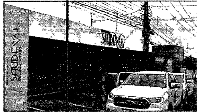
OPERAÇÃO ESTEVE EM EMPRESAS INVESTIGADAS

O Ministério Público do Estado do Maranhão, por meio do Grupo de Atuação Especial de Combate às Organizações Criminosas (Gaeco), deflagrou, na manhã desta terça-feira, 21, a Operação Fleming, com a finalidade de desarticular organização criminosa investigada por praticar, em tese, os crimes de fraude à licitação, desvio de recursos públicos e "lavagem" de capitais. Participam da operação os Promotores de Justiça integrantes do Gaeco dos núcleos de São Luís, Imperatriz e Timon e a Polícia Civil do Maranhão (1º DECCOR de Timon e 1º DECCOR de São Luís). Atuam, ainda, os promotores de justiça das comarcas de Timón, Caxias, Buriti Bravo, Parnarama, Colinas, Matões e Olho D'Água das Cumbás. A operação também conta com o apoio dos promotores de justiça do Gaeco-PI e das forças de