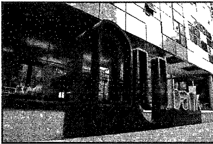
A EMPRESA BUSCA FACILITAR A CONTRATAÇÃO DE EMPRÉSTIMOS PARA ESTA CATEGORIA DE TRABALHADORES

"Além do empréstimo pessoal comum e do empréstimo com dinheiro guardado como garantia, servidores públicos federais que são clientes do Nubank podem solicitar o NuConsignado.