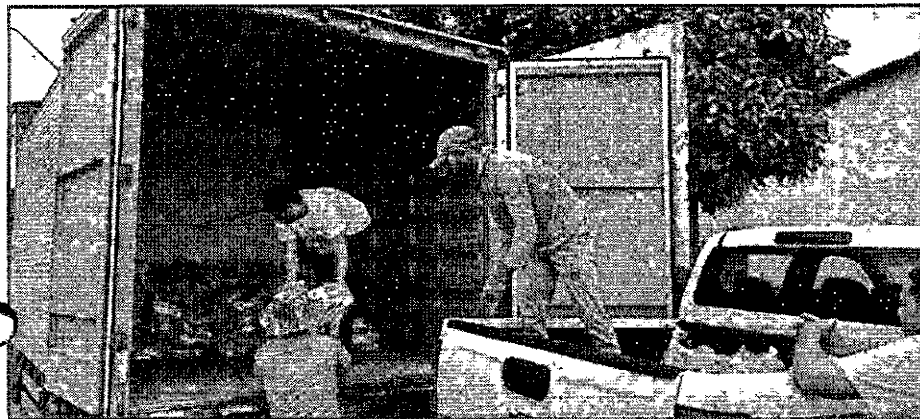
FAMÍLIAS AFETADAS PELAS CHUVAS RECEBEM DOAÇÕES DE CESTAS BÁSICAS

O Governo do Maranhão, por meio da Secretaria de Estado do Desenvolvimento Social (Sedes), está executando uma série de ações para atender os municípios que decretaram situação de emergência em decorrência das fortes chuvas dos últimos dias. A medida, que compõe o plano de ações do Comitê Gestor de Prevenção e Assistência às Populações Vítimas das Chuvas (CPAV), está sendo executada em conjunto