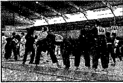
JUDÓCAS DO MARANHÃO PARTICIPAM DE TREINO PROMOVIDO PELA FMJ.