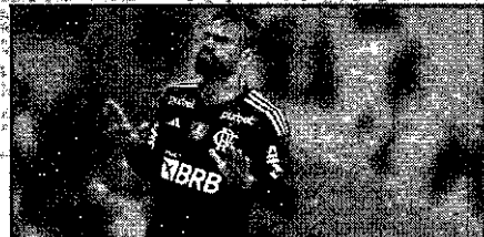
CÓM BOAS ATUAÇÕES, FABRÍCIO BRUNO GANHÁ A CONFIANÇA DE VITOR PEREIRA