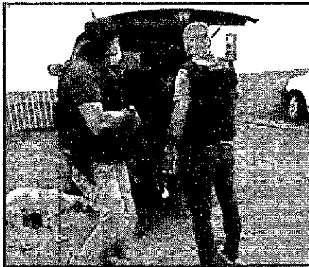
MOMENTO DA DETENÇÃO DO NAMORADO DA ADOLESCENTE

No endereço, a adolescente foi localizada na companhia do suspeito. Na ocasião, o falso sequestrador ainda tentou fugir pelos fundos do imóvel, mas foi capturado pelos policiais. Os dois foram levados para a Delegacia de Ribamar.