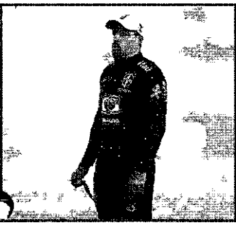
RAMON, TREINADOR INTERINO DA SELEÇÃO BRASILEIRA

No primeiro treino com os 23 convocados à disposição, o técnico interino da seleção brasileira, Ramon Menezes, esboçou nesta terça-feira a escalação para o amistoso contra Marrocos. A partida será no sábado, às 19h (de Brasília), no Estádio Ibn Batouta.