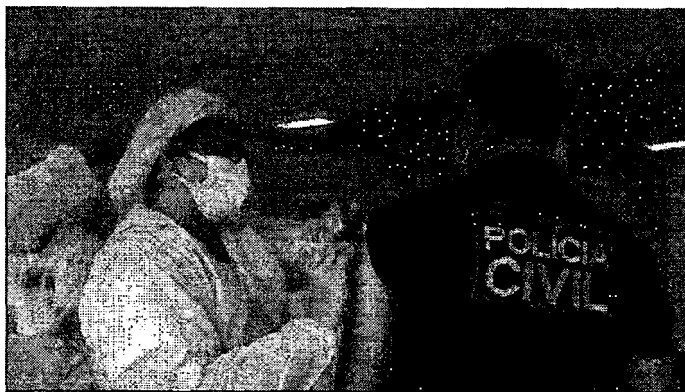
Chegou a vez dos servidores da segurança se imunizarem contra a Covid no Maranhão

O início da vacinação se dará por profissionais das seguintes corporações: Polícia Militar, Polícia Civil, Polícia Federal, Corpo de Bombeiros, Guarda