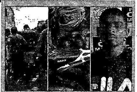
Um dos mortos, conhecido como Zinho, tinha passagem por tráfico