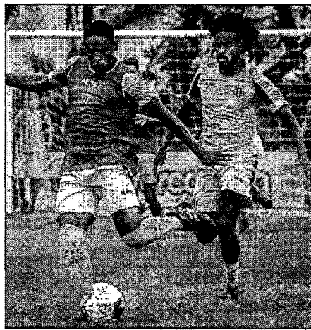
Tricolor deve ter algumas trocas na partida desta quarta

O jogo contra o Pinheiro pelo Maranhense será realizado nesta quarta-feira, às 18h30, no Castelhão. Também no Gigante do Outeiro da Cruz, o Tricolor recebe no sábado o CSA pela Copa do Nordeste, às 16h.