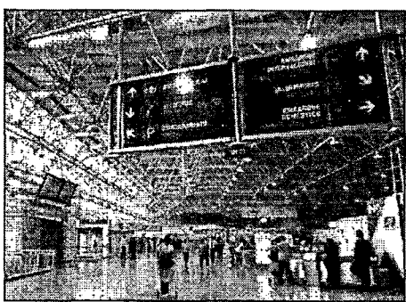
O aeroporto de São Luís será leiloado na quarta-feira

O primeiro leilão da semana será o da concessão de 22 aeroportos, marcado para quarta-feira (7), a partir das 10h, na sede da B3, em São Paulo. Na quinta-feira (8), será a vez do leilão da Ferrovia de Integração Oeste-Leste (Fiol). Na sexta-feira (9), serão ofertados 5 terminais portuários (4 no Maranhão e 1 no Rio Grande do Sul).