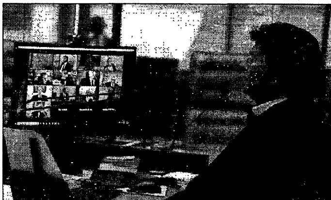
Sessão sobre liberação dos cultos será remota, sob a presidência de Luz Fux

No sábado (3), o ministro Nunes Marques determinou em caráter liminar (provisório) que estados, municípios e Distrito Federal não podem editar normas de combate à pandemia do novo