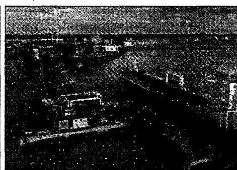
Quatro terminais do porto do Itaqui vão a leilão na sexta

Bloco S (9 aeroportos): Curitiba (PR), Foz do Iguaçu (PR),