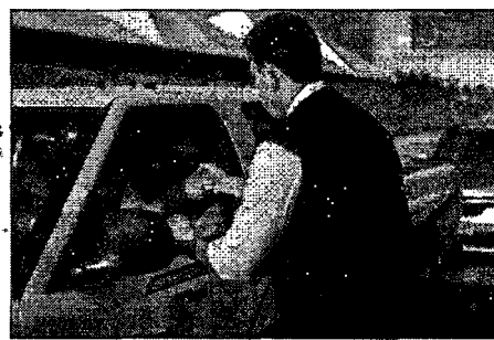
Prefeito Eduardo Braide acompanhou início da vacinação, ontem

Durante o início do atendimento, o prefeito Eduardo Braide destacou a importância desta nova etapa da vacinação. "Os profissionais das forças de segurança estão prestando um papel fundamental desde o início da pandemia.