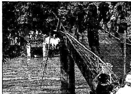
A 'ponte metálica' de Bacabal na verdade tinha uma parte feita de madeira

Há meses, moradores reclamavam da estrutura precária da ponte, construída com metal e madeira.